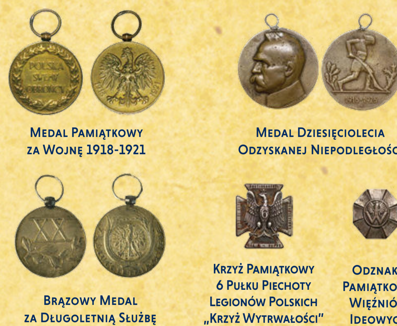
Medal Pamiątkowy za Wojnę 1918-1921, Medal Dziesięciolecia Odzyskanej Niepodległości, Brązowy Medal za Długoletnią Służbę, Krzyż Pamiątkowy 6 Pułku Piechoty Legionów Polskich „Krzyż Wytrwałości”, Odznaka Pamiątkowa Więźniów Ideowych