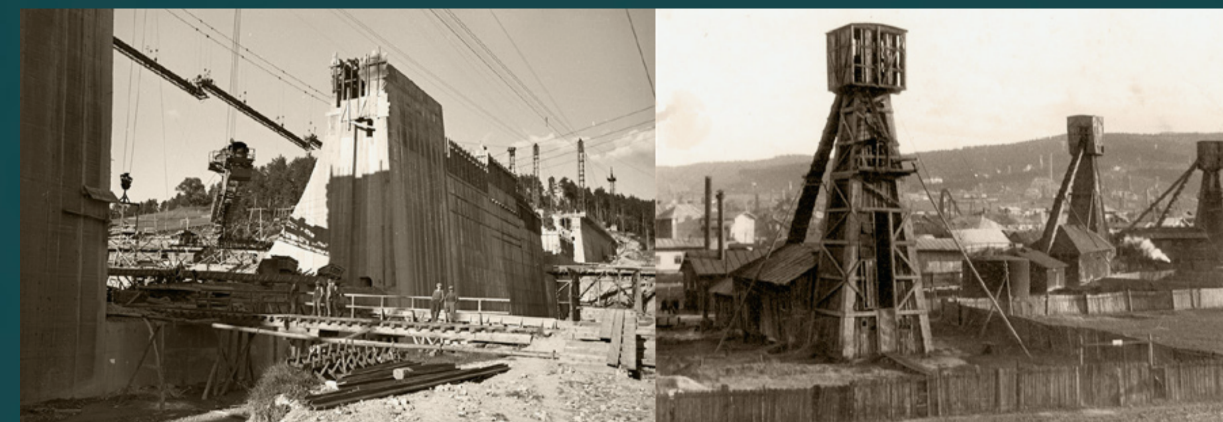
Budowa zapory i elektrowni wodnej na Dunajcu w miejscowości Rożnów, początek 1935 r.

USTRÓJ I POLITYKA Najważniejszymi wydarzeniami kształtującymi ustrój i polityczny obraz Polski były: uchwalenie Konstytucji marcowej (1921 r.), która gwarantowała ustrój demokratyczny, parlamentarno-gabinetowy; wybór Gabriela Narutowicza na prezydenta (1922 r.) i śmiertelny zamach na niego; przerwot majowy (1926 r.), w wyniku którego Józef Piłsudski przejmuje władzę i rozpoczynają się rządy sanacji; Konstytucja kwietniowa (1935 r.), która znacząco wzmocniła prezydenta, tworząc ustrój autorytarny.