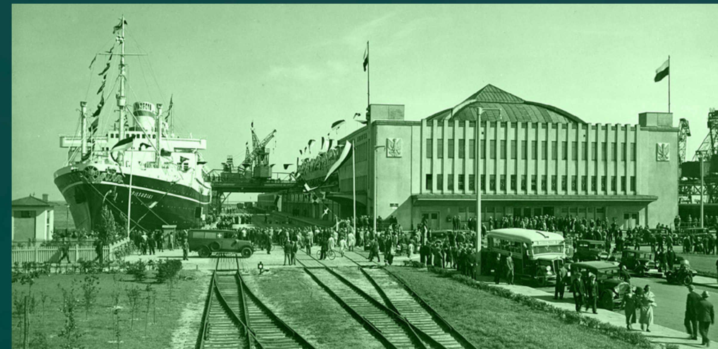
Gdynia, budynek Dworca Morskiego, otwarty 29.IV.1923 r., z lewej statek „Piłsudski”

ODZYSKANIE NIEPODLEGŁOŚCI Po 123 latach zaborów Polska odzyskała niepodległość! Naród polski kilkakrotnie zrywał się do walki o wolność, ale bezskutecznie. Pięć pokoleń podtrzymywało ducha polskości, opierało się germanizacji i rusyfikacji. 11 listopada 1918 roku ogłoszono ustanowienie państwa polskiego w granicach uwzględniających uwarunkowania historyczne. Ojcami Niepodległej byli mężowie stanu: Józef Piłsudski, Roman Dmowski, Ignacy Jan Paderewski, gen. Józef Haller, Ignacy Daszyński, Wincenty Witos i Wojciech Korfanty.