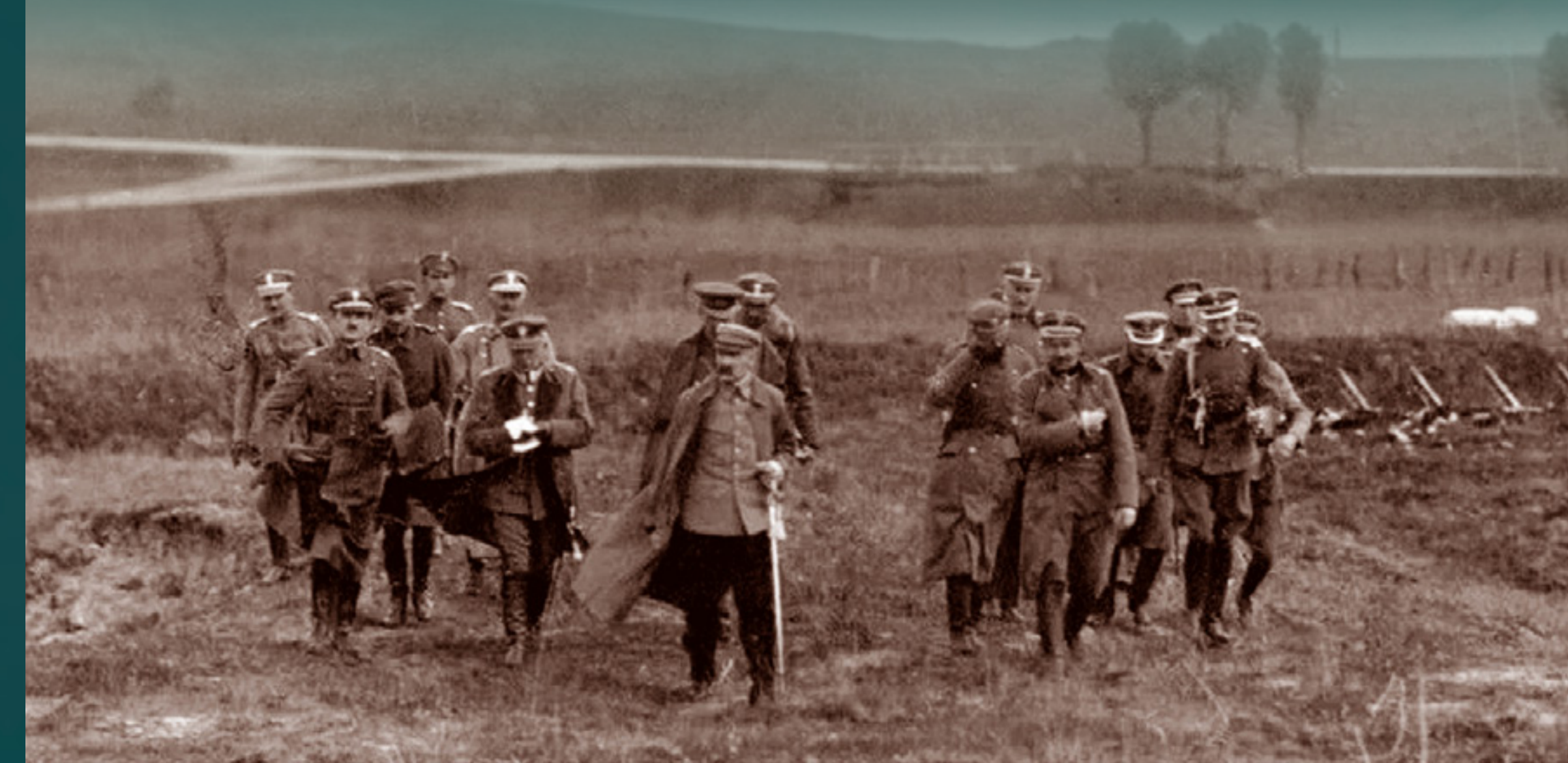
Naczelny Wódz Józef Piłsudski wraz ze swoimi sztabowcami, sierpień 1920 r.

11 LISTOPADA – PO 123 LATACH ZABORÓW – POLSKA ODZYSKUJE NIEPODLEGŁOŚĆ. JÓZEF PIŁSUDSKI PRZEJMUJE WŁADZĘ WOJSKOWĄ OD RADY REGENCYJNEJ, OBEJMUJE STANOWISKO NACZELNIKA PAŃSTWA I POWOŁUJE GABINET PREMIERA JĘDRZEJA MORACZEWSKIEGO. 29 GRUDNIA ROKU ROZPOCZYNA SIĘ PIERWSZY PÓBÓR REKRUTA DO WOJSKA POLSKIEGO.