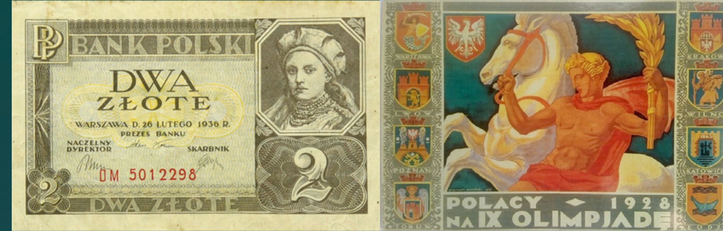
Banknot zaprojektowany przez Zdzisława Eichlera, w obiegu od lutego 1936 r.

KSZTAŁTOWANIE GRANIC PAŃSTWA Granice II Rzeczypospolitej formowały się na drodze negocjacji, plebiscytów i działań zbrojnych, w oparciu o kryteria narodowościowe, historyczne i strategiczne, od końca 1918 r. aż do 1922 r. [Powstanie wielkopolskie (1918–1919); Wojna polsko-ukraińska o Lwów i Galicję Wschodnią (1918–1919); Wojna polsko-bolszewicka (1919–1921); Trzy powstania śląskie (1919–1921); Plebiscyty na Warmii, Mazurach i Powiślu (1920); Zajęcie Wileńszczyzny przez gen. Żeligowskiego (1920)].