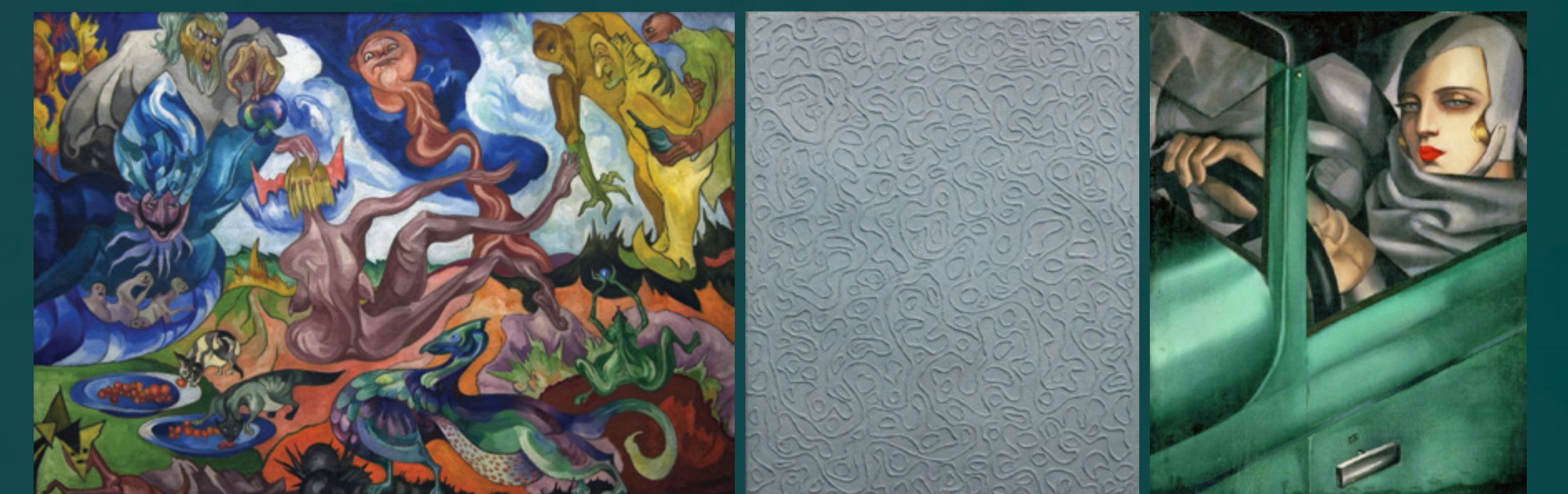
Od lewej: Stanisław Ignacy Witkiewicz „Tworzenie świata”, 1921–1922; Władysław Strzemiński „Kompozycja unistyczna-12”, 1932 r.; Tamara Łempicka „Autoportret w zielonym Bugatti”, 1929 r.

EDUKACJA Największym osiągnięciem państwa była reforma szkolna Janusza Jędrzejewicza (1932 r.) polegająca na ujednoczeniu systemu edukacji. W ciągu 20 lat trzykrotnie zmniejszono poziom analfabetyzmu. Powstały nowe uczelnie: Uniwersytet Wileński i Katolicki Uniwersytet Lubelski.