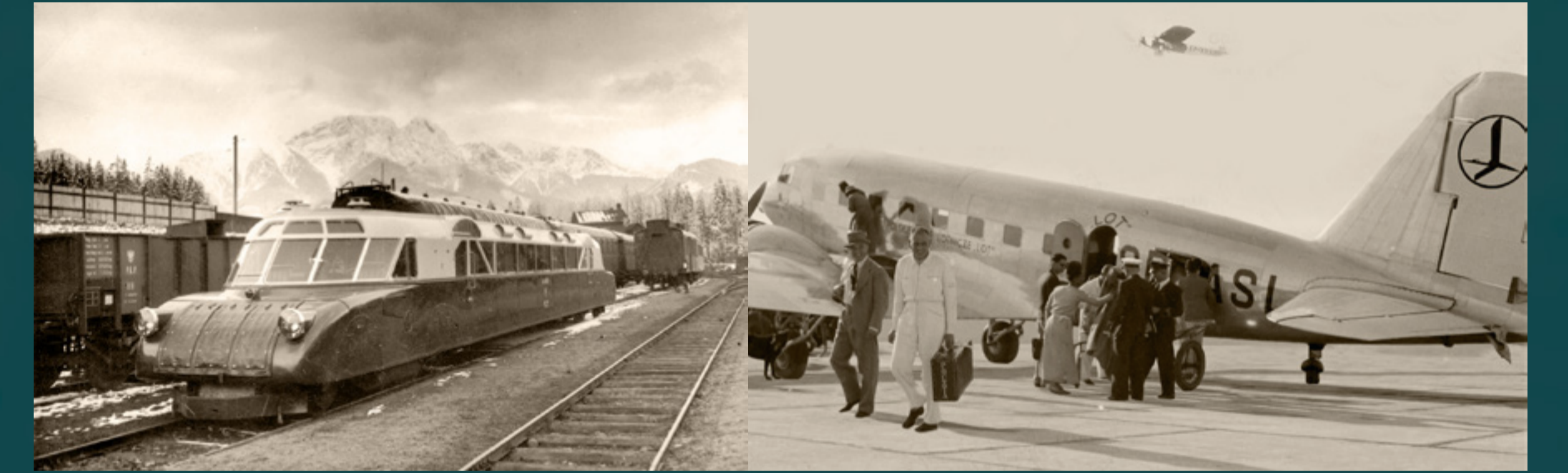
Luxtordeda na stacji w Zakopanem, 1936 r.

FIZYKA I CHEMIA W 1932 r. z inicjatywy Marii Skłodowskiej-Curie otwarto Instytut Radowy w Warszawie, który prowadził badania nad promieniotwórczością i leczeniem nowotworów.